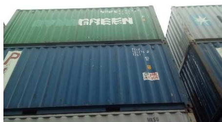
Hittad! Vår container i Mombasas hamn.