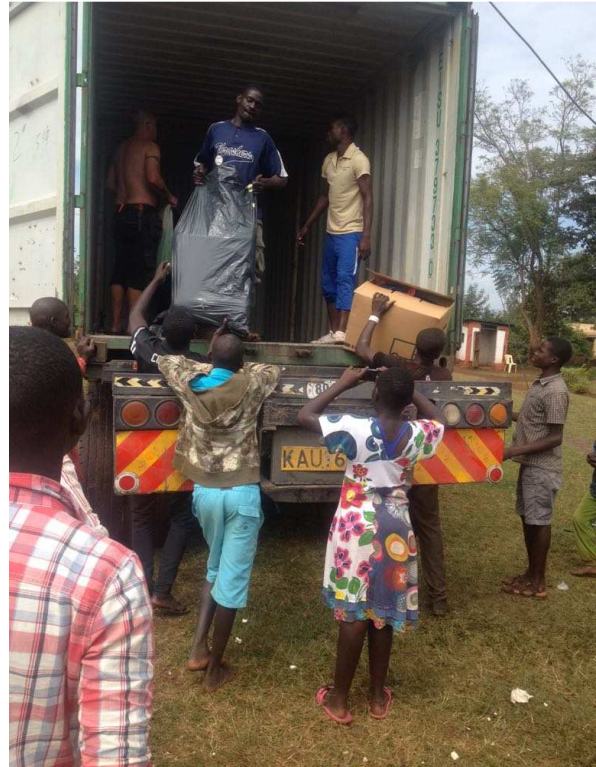
Det som tog elva dar att lasta i tog tre timmar att lasta ur.