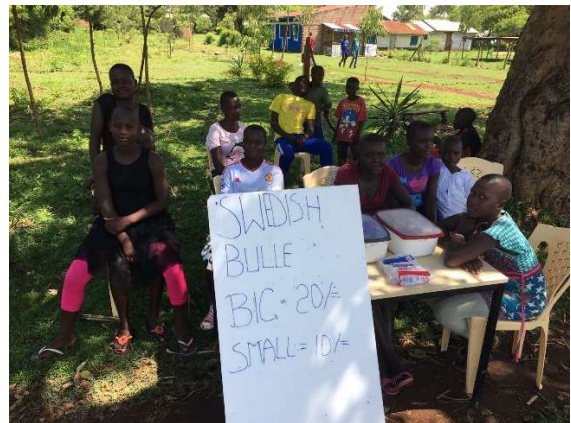
De skollediga barnen säljer bullar.

Några dagar före jul kom så beskedet -Vattenpumpen krånglar. Det har inte regnat på tre dagar och vi kan inte pumpa upp mer vatten. Vad ska vi göra? Några kontrollmätningar tyder på att det är kortslutning i pumpmotorn så nu måste pumpen dras upp ur hålet och motorn undersökas och eventuellt bytas. I skivande stund så vet vi inte riktigt hur det går men förhoppningsvis ska Lwala ha en fungerande vattenpump innan Stellan och Jesper reser hem på Nyårsafton. Ett nödrop på