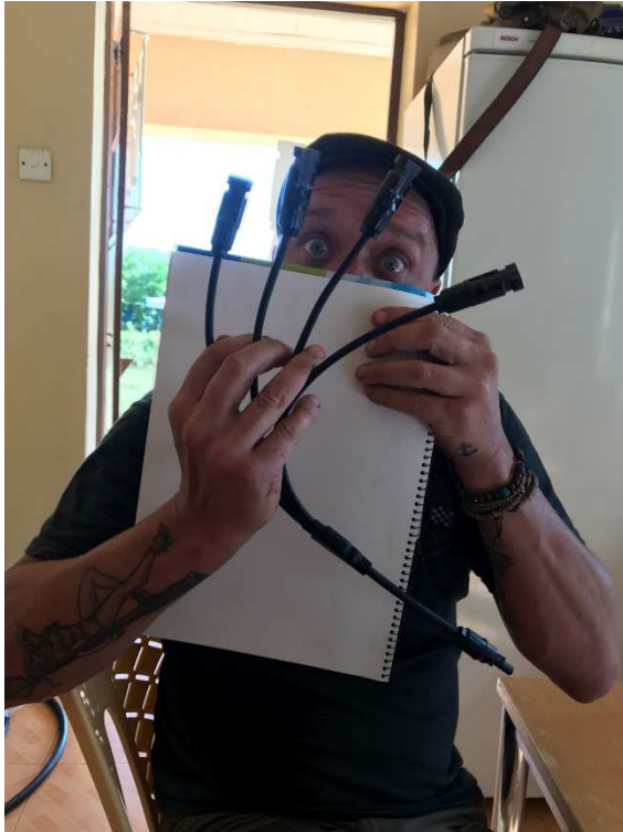
Hjälp! Vad ska man ha de här till?