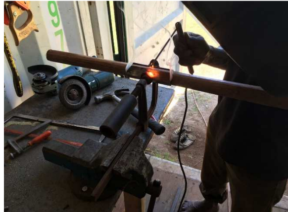
Nu är det bra med en egen verkstad.