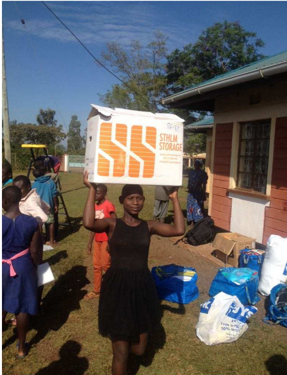
Alla hjälptes åt att lasta ur.