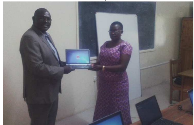
Datorer från Sverige överlämnas till IT-skolan i Migori. De tio första av fjorton.

I januari börjar skolan igen och nu kommer det att vara fyra flickor som går på gymnasiet. Genom stiftelsen kan du bli skolfadder för 200 kronor per månad vilket möjliggör barnen skolgång på gymnasiet.