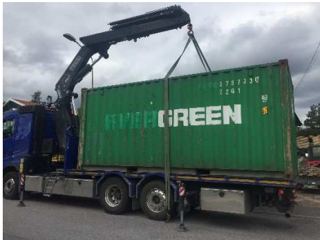
Så kom då containern.

men dom är transportskadade! Panik! Hem till Täby för att kolla. Hela transportemballaget hade kollapsat under transporten från Tyskland. Allt låg huller om buller men som tur var så var bara en panel riktigt skadad. Vi kontrollmätte den och kunde konstatera att den ändå levererade ström. Vi kunde fixa fram en ersättningspanel och lastade in den skadade som reserv.