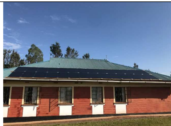
4000 Watt tunnfilmspaneler.