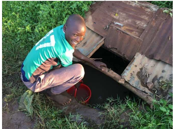
Byns brunn ligger ett par kilometer bort.

Den 23 december får barnen sin julklapp. En privat donation gör att de kan göra en heldagsutflykt med buss. Turen tar dem till flygplatsen i Homa bay där de förhoppningsvis får se ett plan starta på nära håll. Därefter åker de till nationalparken Ruma park där de säkert får se en hel del vilda djur. Utflykten avslutas med lekar på stranden i Sori vid Victoriasjön. En annan privat donation gör att barnhemmet kan ordna med lite extra festlig mat på julafton.