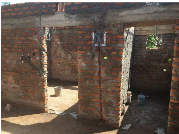
Till vänster ett sovrum av två, till höger badrum av två. Bilden tagen från allrummet/köket.