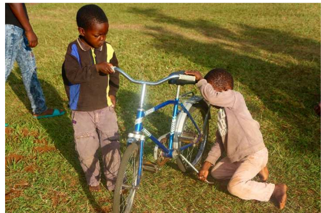
Alla hjälps åt med cyklarna och snart kan alla barnen cykla.