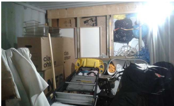
...och packa och packa.