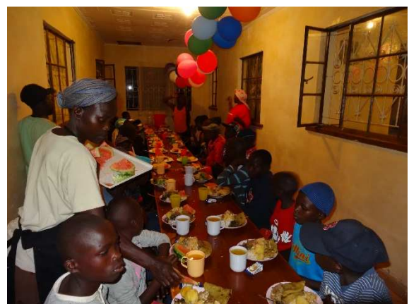
Bilden är från nyårsafton 2016.