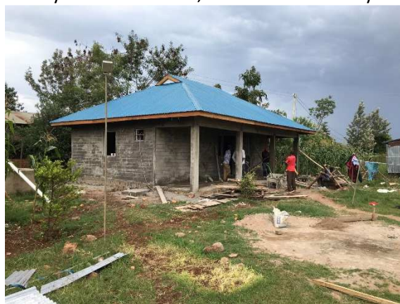
Taket på. Det skiljer ca sex veckor mellan denna bild och bilden på avloppen.

Under året har vi jobbat mycket med Facebooksidan "Lwala barnhem, Kenya" och har nu över 160 följare. Vi har blivit sponsrade med nära 95 000 kronor från både privata givare och företag. Utöver detta fick vi ett stort antal begagnade men alldeles utmärkta bärbara datorer från en organisation. En del av dessa finns nu på IT-skolan i Migori. Resterande ska tas till barnhemmet i olika omgångar. Vi hoppas att våra sponsorer ska bli fler och att de företag och organisationer som hjälpt oss i år ska vilja fortsätta med detta framledes. Bland de organisationer som skänkt pengar eller på annat sätt stöttat oss kan nämnas;