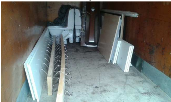
Precis bara börjat fylla vagnen.