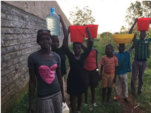
Under tiden så får man hämta vatten.