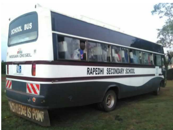
Dags för en utflykt.

Den 23 december får barnen sin julklapp. En privat donation gör att de kan göra en heldagsutflykt med buss. Turen tar dem till flygplatsen i Homa bay där de förhoppningsvis får se ett plan starta på nära håll. Därefter åker de till nationalparken Ruma park där de säkert får se en hel del vilda djur. Utflykten avslutas med lekar på stranden i Sori vid Victoriasjön. En annan privat donation gör att barnhemmet kan ordna med lite extra festlig mat på julafton.