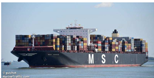
MSC Venice som tog container från Antwerpen till Förenade Arabemiraten.