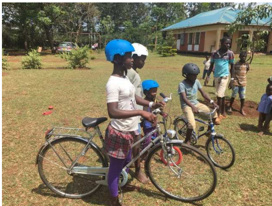
Cyklar i olika storlekar.

Stort tack till er alla och till alla privatpersoner som via donationer gjort det möjligt för oss att skicka ner jättefina skor, kläder, fotbollsutrustningar, leksaker, verktyg, cyklar, datorer mm, mm. Lika viktiga är ni som regelbundet donerar pengar till den dagliga driften via hjälporganisationen Trosnistan.