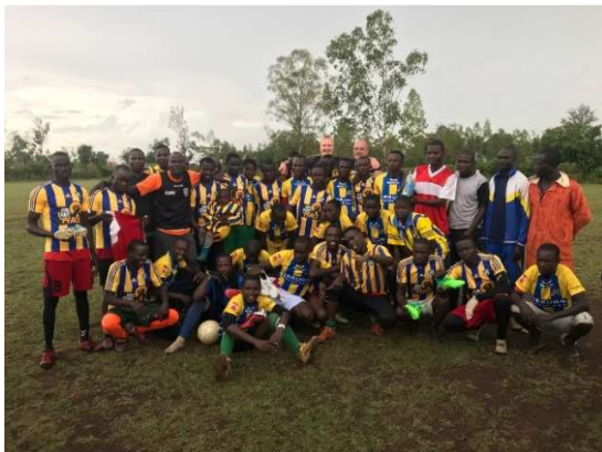
Det lokala fotbollslaget i Rapedhi, samhället där Lwala barnhem ligger.